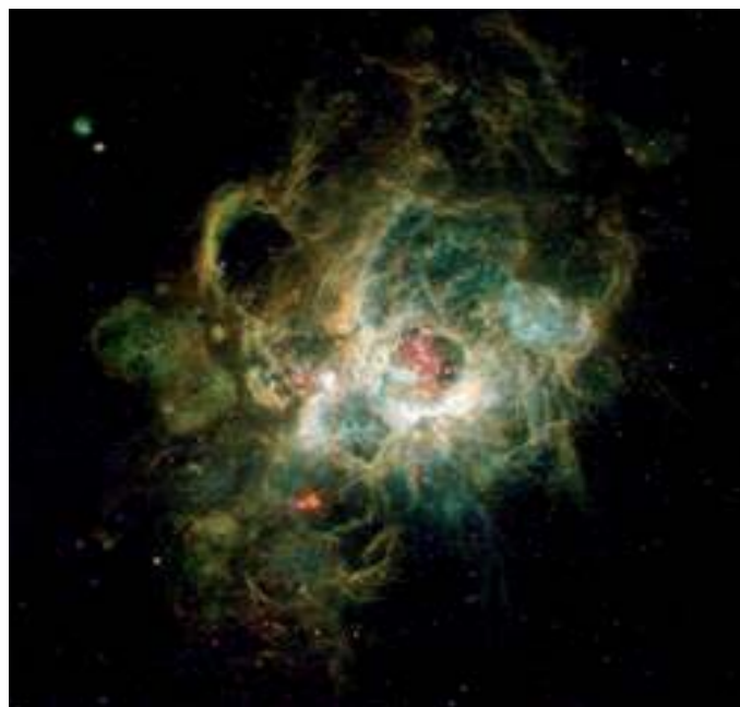
Supernovae dans la galaxie M33

Entrées : Plein tarif : 9 e / Tarif réduit : 7 e Sandwicherie, boutique sur place